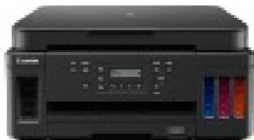
Figura 2: Impresora multifuncional