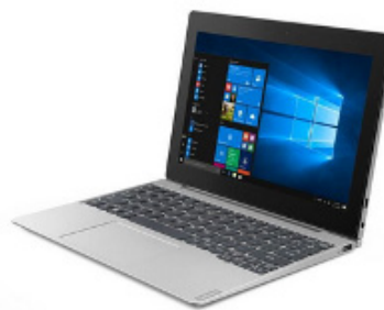
Figura 3: Notebook de gama media